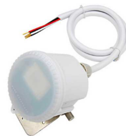
555.747921.22 Helligkeitssensorik / Präsenzmelder Schwellenwert 150 Lux