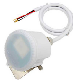
555.747921.22 Helligkeitssensorik / Präsenzmelder Schwellenwert 150 Lux